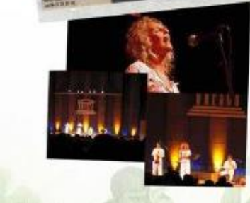
L'album CD du projet est paru en juillet 2008 et est actuellement disponible .

Droits réservés, textes et photos fournis par l'Association Zefir 1 allée Philippe Quinault – 78170 La Celle Saint Cloud Tél 06 61 85 73 01 / 01 30 78 01 35 Pascaleduard.morrow@gmail.com www.zefir.asso.fr